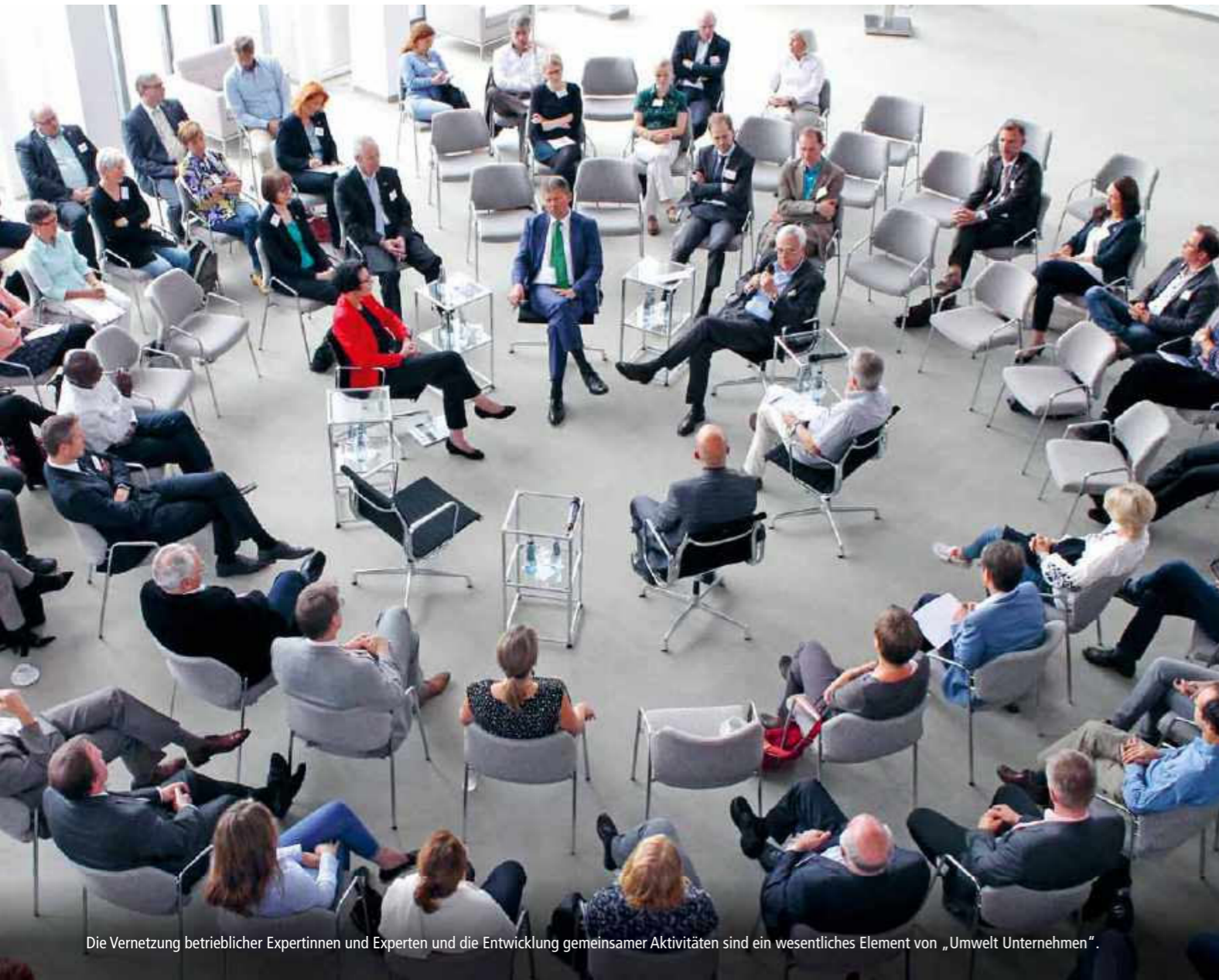
Die Vernetzung betrieblicher Expertinnen und Experten und die Entwicklung gemeinsamer Aktivitäten sind ein wesentliches Element von „Umwelt Unternehmen“.

Betrieblicher Umweltschutz und nachhaltige Entwicklung – zwei Aspekte, die bei „Umwelt Unternehmen“ und RENN.nord eine bedeutende Rolle spielen. Grund genug für das Bremer Unternehmensnetzwerk und die Aktionsplattform für nachhaltige Entwicklung diese Broschüre des Pilotprojekts „NaGut – Nachhaltig Gut Arbeiten“ zu unterstützen.